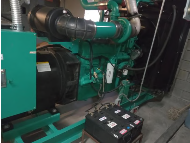
ANTES DEL MANTENIMIENTO

(Todos los croquis, fotografías o dibujos deberan de estar acompañados de comentarios u observaciones).