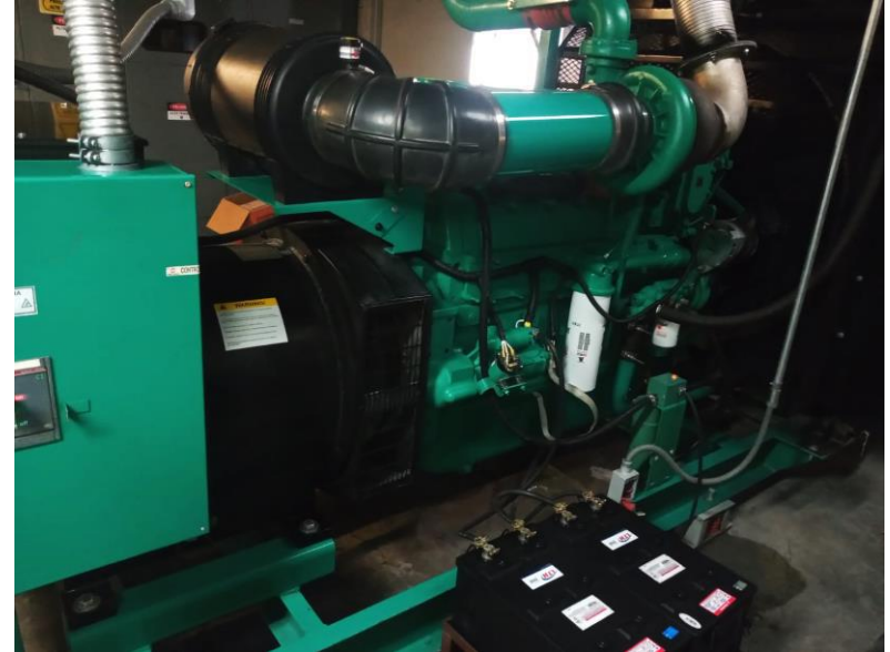
DESPUES DEL MANTENIMIENTO